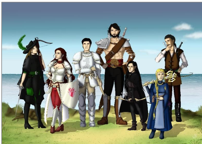
Die Helden der Dracheninseln wurden von Künstlerin Lisa Mentel kreiert.